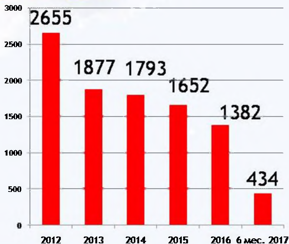
Число проверенных ЮЛ и ИП

соотношение, характеризующее результативность контрольно-надзорной деятельности Управления в 2012-2016 гг. и 6 мес. 2017г.