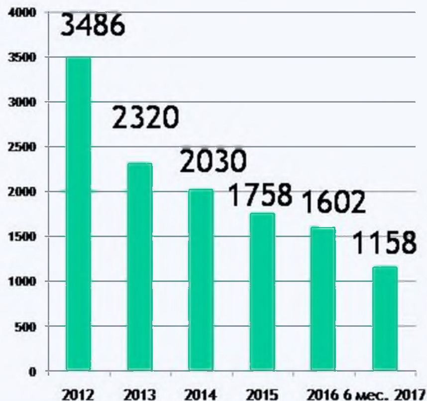
Общее число проверок

Число проверенных ЮЛ и ИП, а также общее число проверок сократилось в 1,9 и 1,6 раза соответственно.